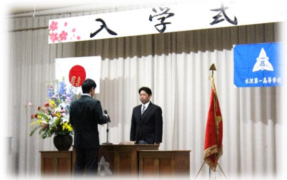
立派な、新入生宣誓