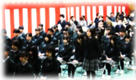
1人1人の呼名 元気な返事

会場準備をしてくれたのは、新2年生でした。手際が良く、素敵に配置をしてくれました。入学式の入場曲は、吹奏楽部が演奏してくれました。とても良かったです。片付けは、バドミントン部と野球部に手伝ってもらい、これまたあっという間に終わりました。皆さん、ありがとう！